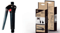
MANETA IK (INOX) cod. 8.26.71.872

Manguera de diámetro 12mm. Aporta facilidad de movimiento y resistencia química.