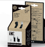
Juego de boquillas para pulverizador IK Multi 6-9-12 cod. 8.26.71.871