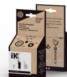
Kit de mantenimiento IK Multi 6-9-12 cod. 8.26.71.874