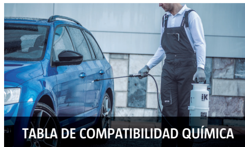
TABLA DE COMPATIBILIDAD QUÍMICA