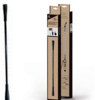
TUBO DE FIBRA DE VIDRIO CON TUERCAS DE 47 CM cod. 8.26.71.873

Maneta versátil y adaptable a cada aplicación.